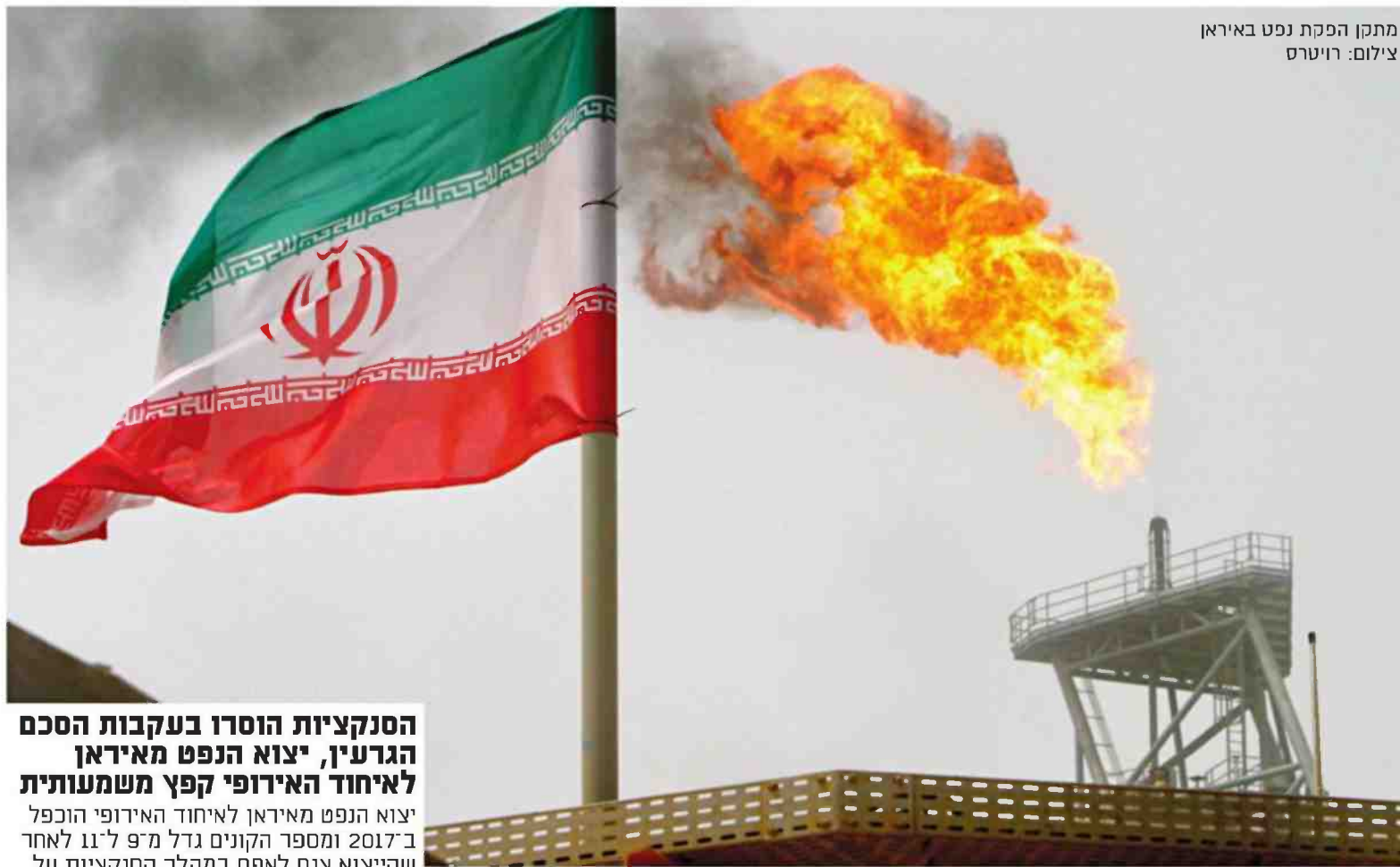
מתקן הפקת נפט באיראן